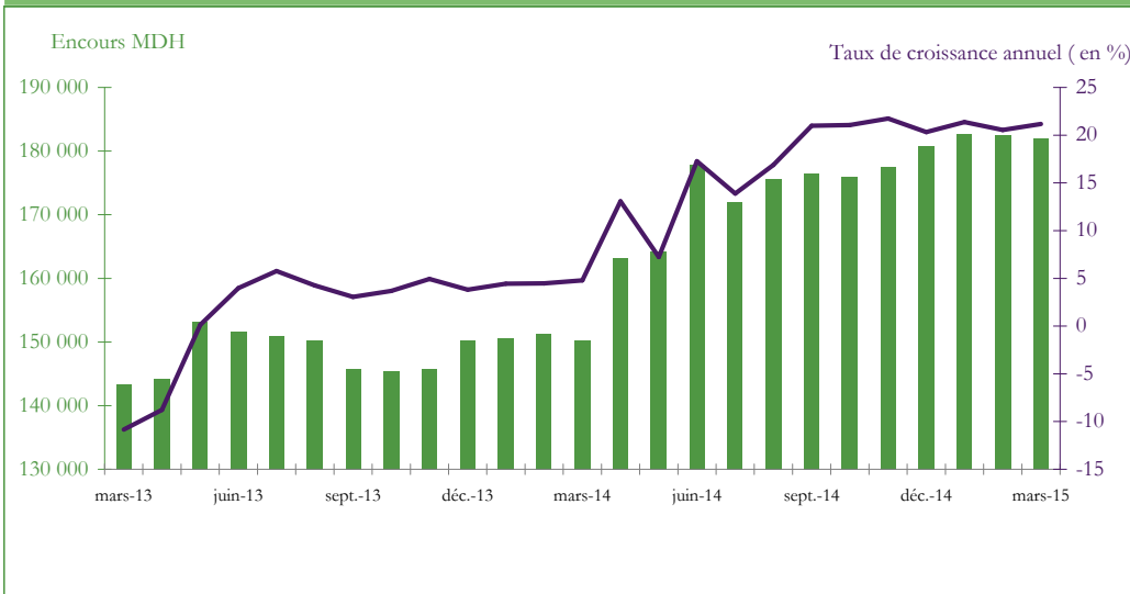
Graphique 3 : EVOLUTION DES RESERVES INTERNATIONALES NETTES