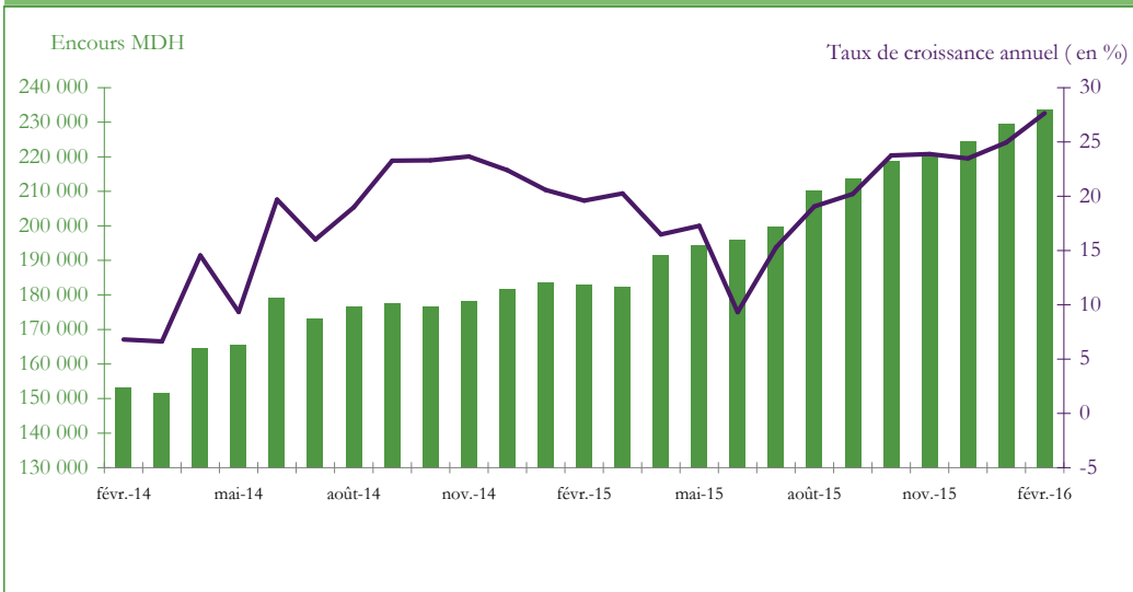
Graphique 3 : EVOLUTION DES RESERVES INTERNATIONALES NETTES