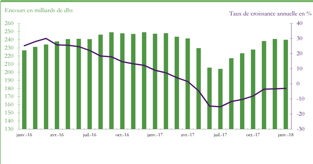
Graphique 3 : EVOLUTION DES RESERVES INTERNATIONALES NETTES