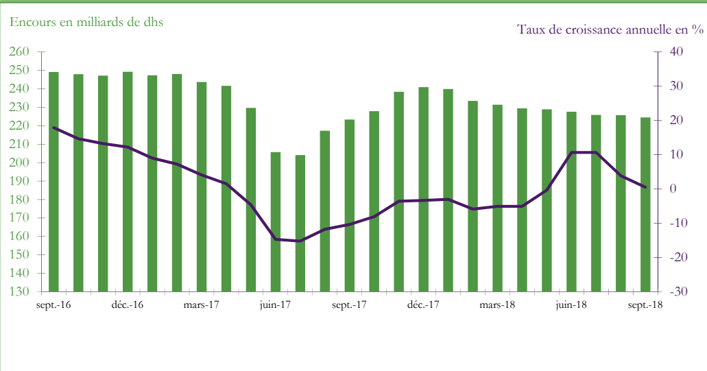
Graphique 3 : EVOLUTION DES RESERVES INTERNATIONALES NETTES