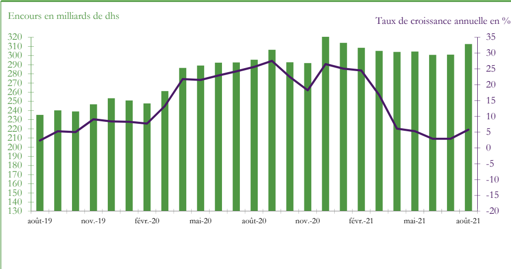
Graphique 3 : EVOLUTION DES AVOIRS OFFICIELS DE RESERVE