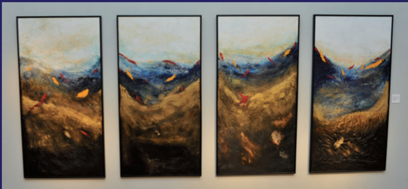
Wafaa Mezouar (née en 1957), Atlantide, 2010 (Quadryptique), Acrylique sur toile, 90 x 90 cm X 4