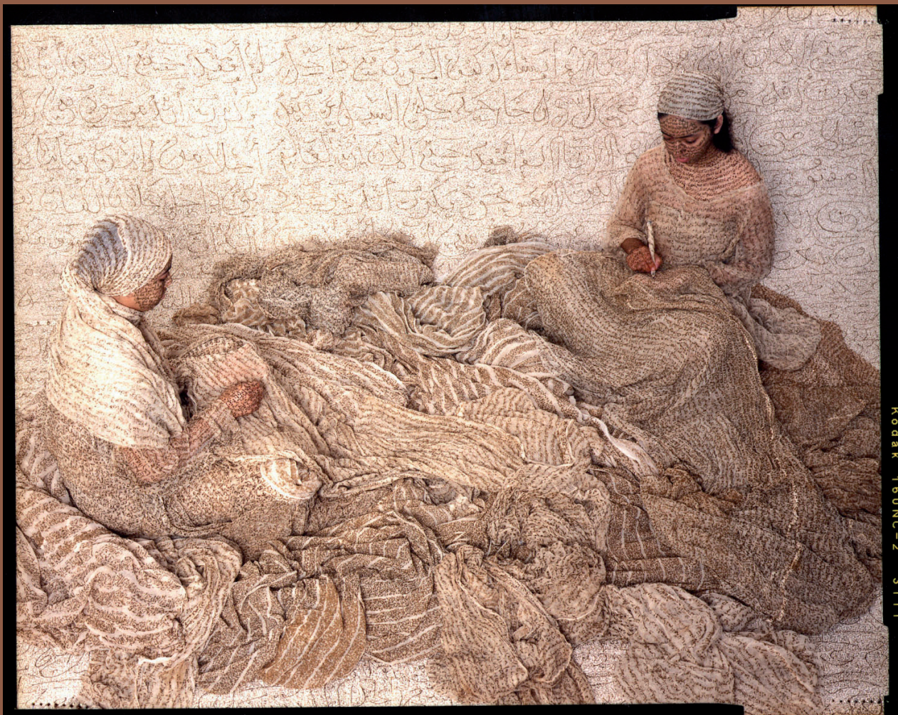
Lalla Essaydi (née en 1956), Harem Women Writing, 2008, Tirage chromogène argentique sur aluminium, 121 x 148 cm.