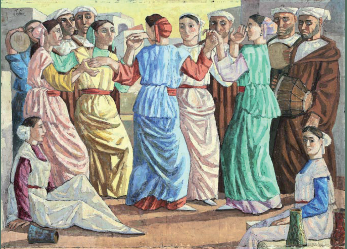
Meriem Mezian (1930 – 2009), Ahouach, Huile sur toile, 180 x 130 cm