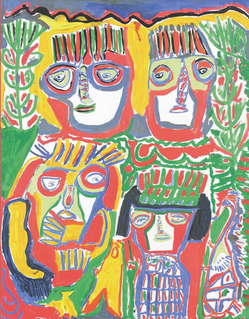
Chaïbia Tallal (1929 – 2004), Les musiciens, 1990, Huile sur toile, 180 x 140 cm